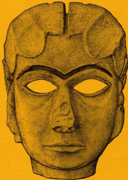
The Lady of Warka Disappeared during the plundering of the Iraq Museum. Recovered by Iraqi archaeologist at the end of September

Cuestiones centrales en la arqueología del Oriente Próximo y Egipto