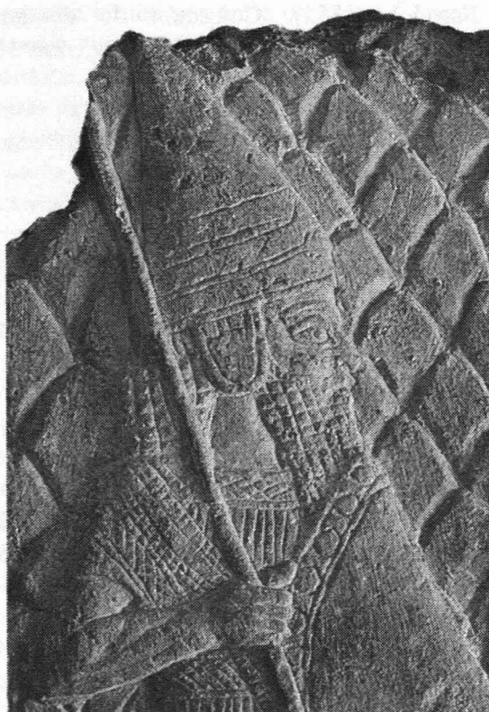
Fig. 2. Relieve con detalle de cabeza de un guerrero asirio.