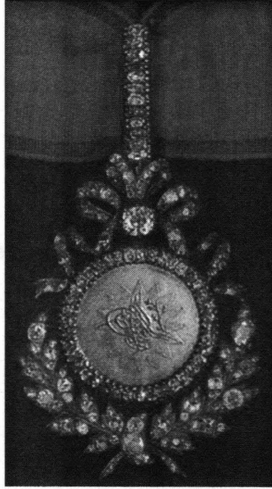
Fig. 5. Medalla turca de la Orden Nishan Yftijar.