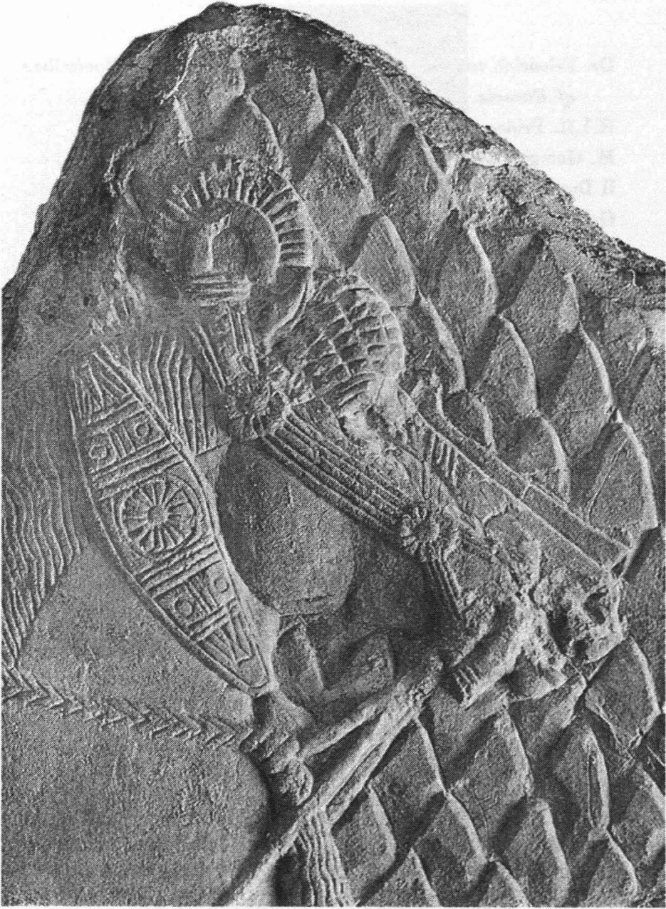
Fig. 3. Relieve con detalle de una cabeza de caballo asirio.