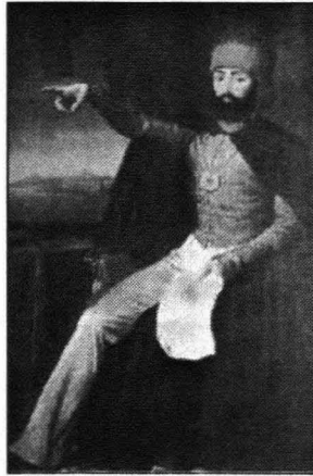
Fig. 6. Sultán Mahmut II con indumentaria europea.