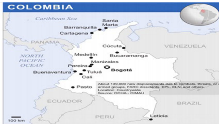
Figura 2 – Principales eventos de desplazamiento interno en Colombia en 2017