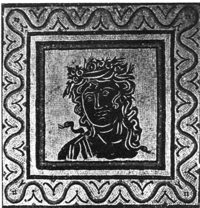
FIG. 4.—Reproducción. R. Lorente.