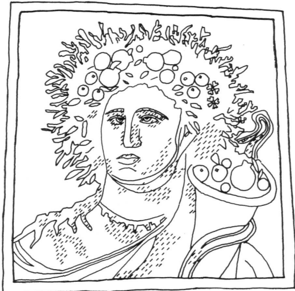
FIG. 2.—Dibujo: C. Ibáñez Ruiz.