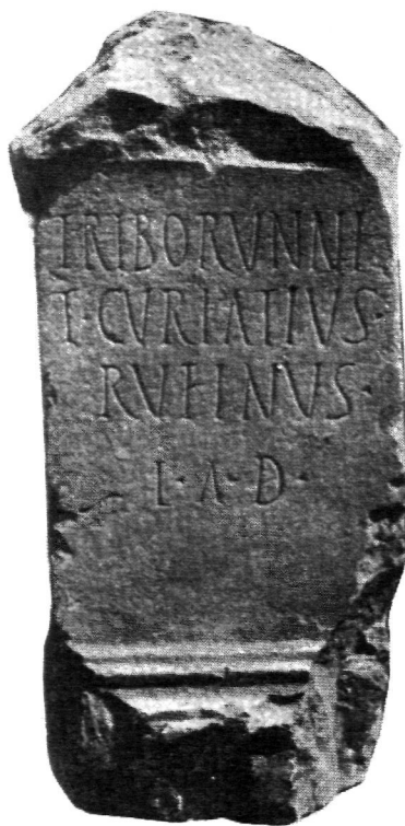
FIG. 5.—Ara de Triburunnis . Villa romana de Freiria, Cascais (según J. d'Encarnação).