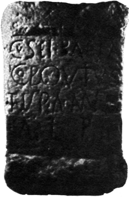
FIG. 7.—Ara de Cusei Paetaico . Aguada de Cima (según P. Carvalho).