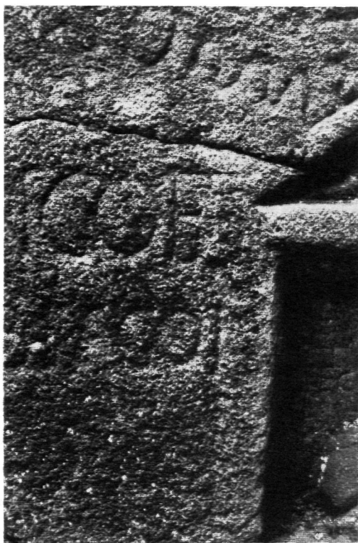
FIG. 10.—Ara de Tongoenabiagoi , Burgos.

55. G. Pereira (59) ha vuelto a tratar la inscripción del ídolo da fonte, Braga (fig. 10), quien propone la lectura de Tongoenabiagoi .