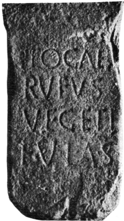
FIG. 6.—Ara de Toga . Sierra de Gato (según M. G. Figuerola).