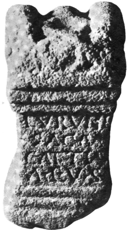
FIG. 8.—Ara de Luruni . Vendas de Cavernães (según A. I. da Sa Ferreira).