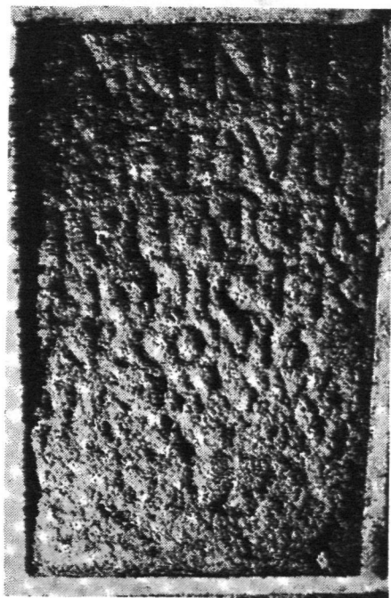
FIG. 2.—Ara de Arentia Equotullaicensis . Sabugal (según F. Patricio Curado).