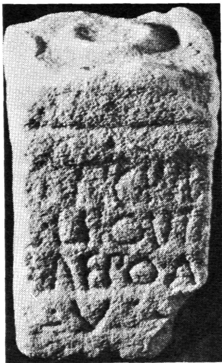
FIG. 3.—Ara de Laepus (según F. Patricio Curado).