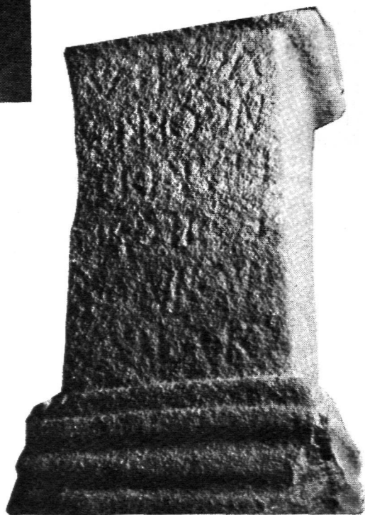
FIG. 4.—Ara de Bandi Longobricu . Longroiva (según F. Patricio Curado).