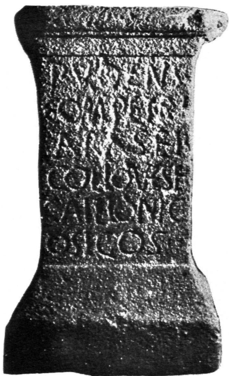
FIG. 9.—Ara de Eicollovesei Caeloni Cosigo . Furtado (según F. Patricio Curado).

49. J. d'Encarnação (53) en su estudio de las inscripciones del conventus pacensis analiza las inscripciones con teónimos indígenas, que son las siguientes: Ataecina , Carneus Calanticensis , deus Carneus Calanticensis , Dea Sancta Burrulobrigensis , Endovellicus , Ocirmira , Proserpina , Quanceius Tannigus , Sanctus Runesus .