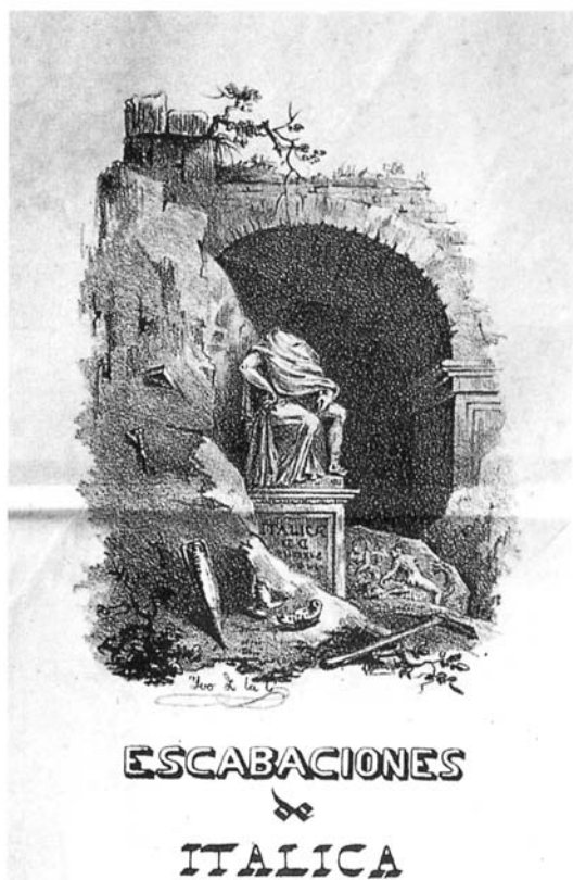
Lám. 2. «Escavaciones de Itálica». Portada de fascículo del primer tomo de la obra Antigüedades de Itálica de Ivo de la Cortina, Sevilla 1840. Firmado abajo a la izquierda: Ivo de la Cortina. En el pedestal se lee ITALICAE y D D (invertidas). El arco de fondo está inspirado en el de Trajano de Mérida.

confusiones que espero ahora poder despejar de su mano, mediante el citado breve escrito que hasta este momento ha permanecido en la sombra.