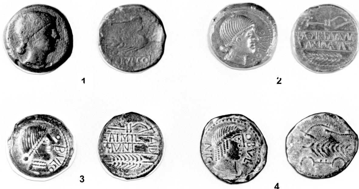
Fig. 4: 1. Duplo de Obulco (MAN); 2. Unidad de Obulco (MAN); 3. Unidad de Obulco (MAN); 4. Unidad de Obulco (Col. Particular)

tando la llegada de nuevos contingentes del mundo púnico norteafricano a partir del siglo IV a.C., sin duda ello reforzó los elementos fenicios en ciudades en las que este componente étnico-cultural era mayoritario, pero también dejaron sentir su acción en el mundo turdetano circunvecino, en absoluto ajeno a este importante componente cultural como sabemos. Será sobre este importante trasfondo cultural sobre el que se desarrollará más tarde la nueva política que introducirán los Barca a partir del 237 a.C., materializado en la llegada de nuevos grupos humanos que participaran en las fundaciones coloniales promovidas por ellos o que serán asentados o establecidos en determinados lugares de lo que luego será la provincia Ulterior . A ello debemos sumar la llegada de tropas que participaron en las diferentes campañas que los cartagineses sostuvieron en Hispania antes de su derrota, tropas que como ha expuesto Domínguez Monedero (1987: 129-138; 1995: 111-116) debieron ser en algunos casos asentados en la península, según se deduce de un pasaje de Apiano ( Iber. , 56) referido a la sublevación del cabecilla lusitano Púnico. Sin querer entrar de lleno en las implicaciones que éstos y otros datos arqueológicos y textuales tienen para ir conociendo el peso del componente étnico-cultural vinculado al mundo púnico norteafricano en la conformación de la realidad indígena del sur peninsular, lo que si parece es que