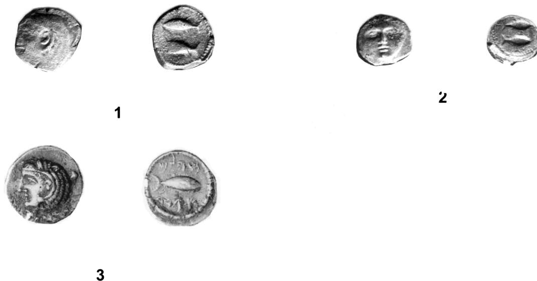
Fig. 2: 1. Mitad de Gadir (Torre Alta, San Fernando, Cádiz); 2. Cuarto de Gadir (Torre Alta, San Fernando, Cádiz); 3. Unidad de Gadir (MAN)