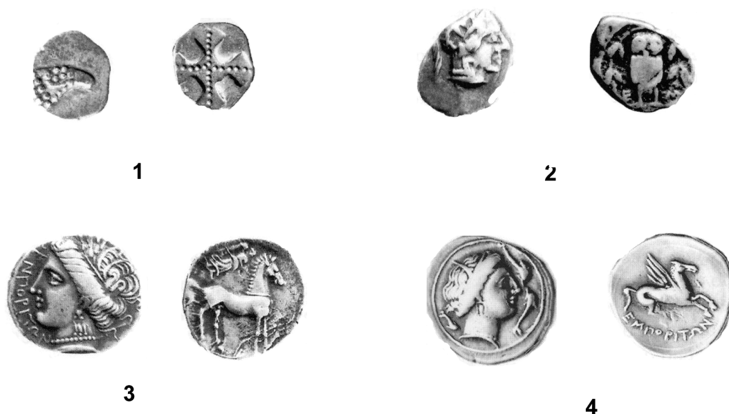
Fig. 1: 1. Fraccionaria de Emporion (Ampliada. GNC/MNAC); 2. Fraccionaria de Emporion (Ampliada. GNC/MNAC); 3. Dracma de Emporion (GNC/MNAC); 4. Dracma de Emporion (GNC/MNAC)

como símbolo de autonomía política de las ciudades que la adoptan, convirtiéndose así en verdadero distintivo de las mismas. Con la moneda, los griegos enseñan el valor de los emblemas nacionales. Las ciudades buscan las imágenes de sus divinidades patronas, protectoras de sus productos económicos o los emblemas parlantes del topónimo como en el caso de Egina , primer tipo cívico bien documentado (Kraay, 1976: 43). Pronto esas imágenes locales se convierten en los emblemas políticos de sus ciudadanos. Es más, aunque existen cecas griegas que comenzaron con una preferencia hacia un sistema iconográfico de tipos múltiples, como el caso de los talleres de Asia Menor o de la propia Atenas, con las conocidas monedas blasones o Wappenmünzen (Kroll, 1981: 1-32), cuando captan que la imagen tiene un valor nacional, la fijan y la convierten en emblema. En el caso de Atenas, este hecho se producirá hacia el c.525-520 a.C., momento en el que la ciudad adopta su tipo cívico, que en adelante va a permitir identificar claramente sus emisiones: la efigie de la diosa Atenea y la lechuga (Kraay, 1976: 56-61).