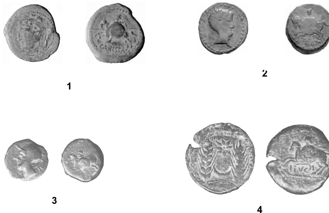
Fig. 5: 1. Mitad de Carisa (Subastas Cayón 2000); 2. Mitad de Carisa (Col. Particular); 3. Mitad de Carisa (MAN); 4. Divisor de Ituci (MAN)

en la última emisión (Fig. 4.4), el efigiar en su anverso una cabeza femenina con un peinado muy característico –una trenza rodea la cabeza para terminar en un moño a la altura de la nuca–; en ocasiones se rodea de una corona de pequeñas hojas, y a veces le acompaña un creciente (Fig. 4). La personalidad estilística de los anversos se refuerza con la singularidad del tipo de los reversos que ayuda a caracterizar el contenido principal de la divinidad, la espiga, tan repetida en todo el Mediterráneo, cobra un sabor especial al combinarla en original composición con arado e incluso en algunas emisiones con un yugo. Es por tanto una divinidad astral, frugífera y protectora de los trabajos agrícolas, sin duda una divinidad acorde por otra parte con la realidad económica de la ciudad, se trata de un importante centro de explotación y redistribución agraria, como han puesto de manifiesto los enormes silos excavados.