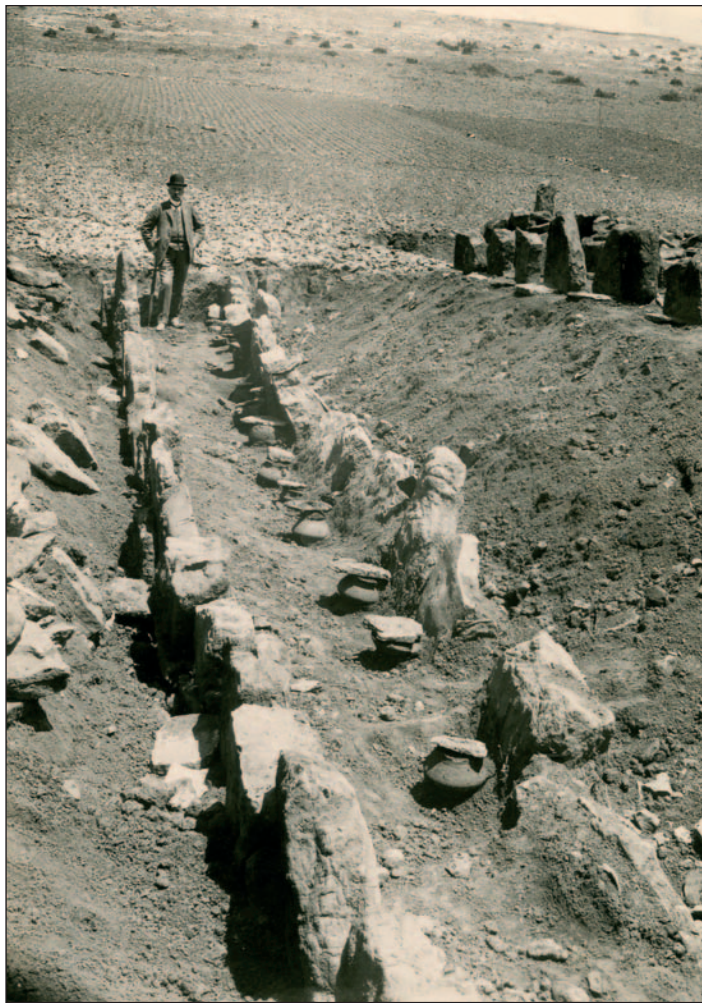
Figura 6. Visita del marqués en la necrópolis de Luzaga (Guadalajara). Legado familia Cabré, UAM (nº inv. 07047).

Cada sala, en principio, estaba dedicada a un yacimiento en concreto y cada conjunto estaba acompañado de una cartela con el nombre del yacimiento o, en el caso de desconocerse, el marqués les asignaba nombres según la tipología del yacimiento añadiendo adjetivos y denominaciones relacionadas con sus características como, por