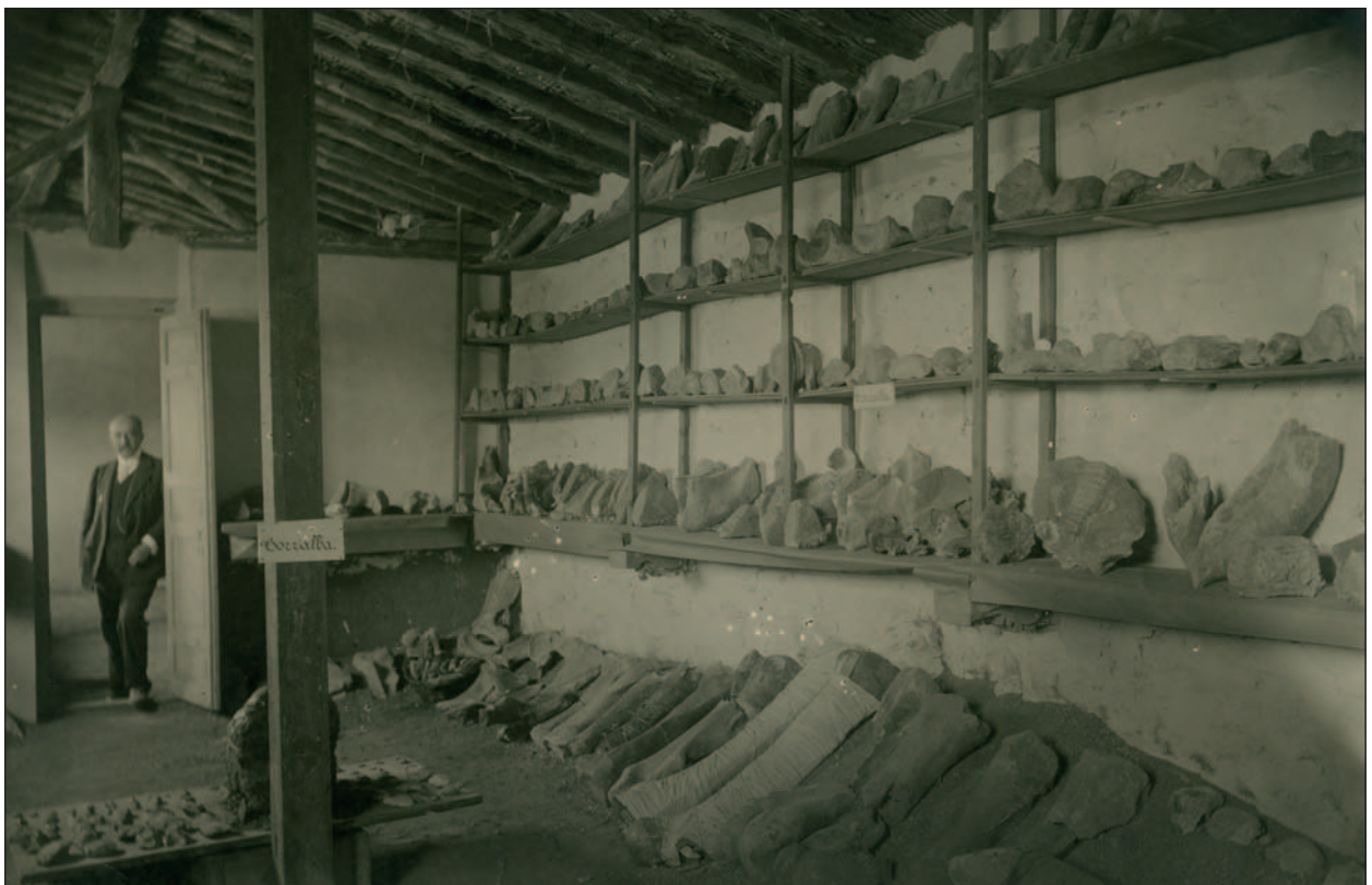
Figura 8. Depósito provisional de materiales arqueológicos procedentes de Torralba (Zaragoza). Al fondo el marqués de Cerralbo. Legado familia Cabré, UAM (n° inv. 11092).