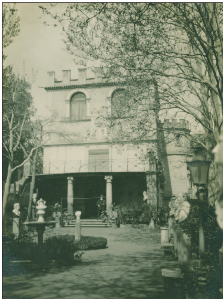
Figura 2. Fachada principal del palacio de Santa María de Huerta. Legado familia Cabré, UAM (n° inv. 12638).

La avenida principal y los distintos espacios ajardinados se adornaba con esculturas, bustos, elementos arquitectónicos y macetas cerámicas. Algunas de aquellas procedían de las compras que marqués realizaba, tanto en España como de