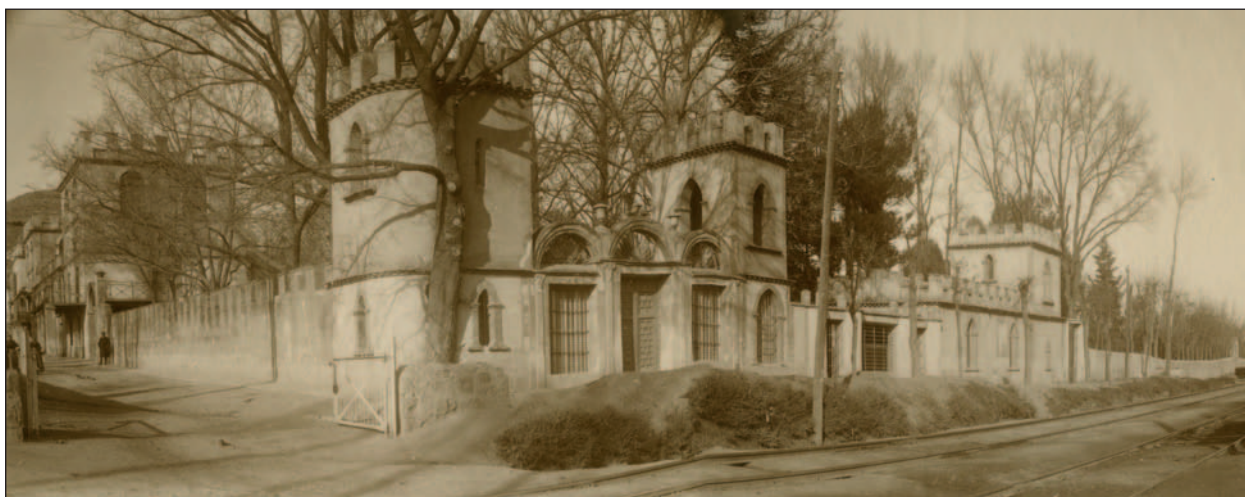
Figura 1. Vista del palacio desde la estación de ferrocarril “Madrid-Zaragoza”. Al fondo, a la izquierda, Enrique Aguilera y Gamboa, el XVIIº marqués de Cerralbo. Legado familia Cabré , UAM (nº inv. 12623 y 12626).

Sabemos que el palacio contaba con dos alturas y que, en principio, la primera planta estaba destinada para la vida en los meses de verano mientras que la segunda era para el invierno. No