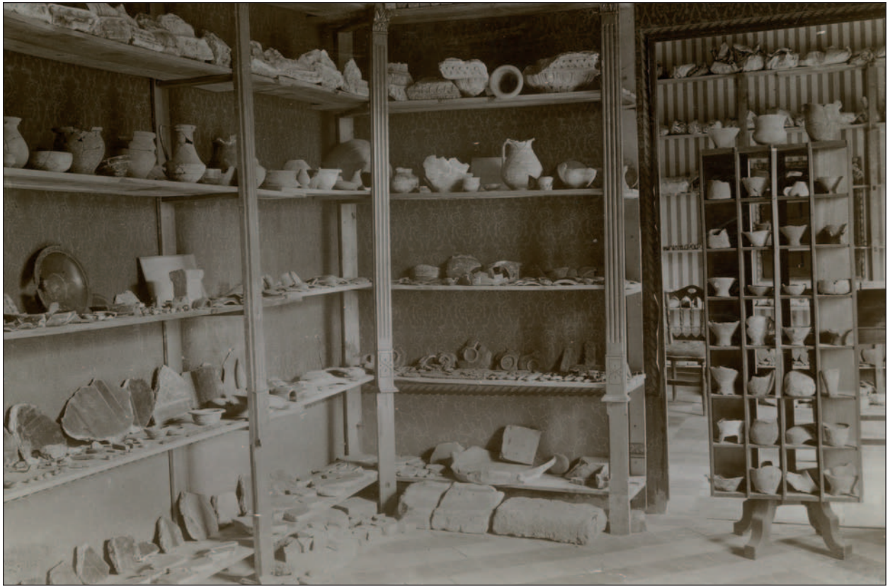
Figura 7. Estancia del palacio dedicada al yacimiento de Arcobriga (Monreal de Ariza, Zaragoza). Legado familia Cabré, UAM (n° inv. 05440).