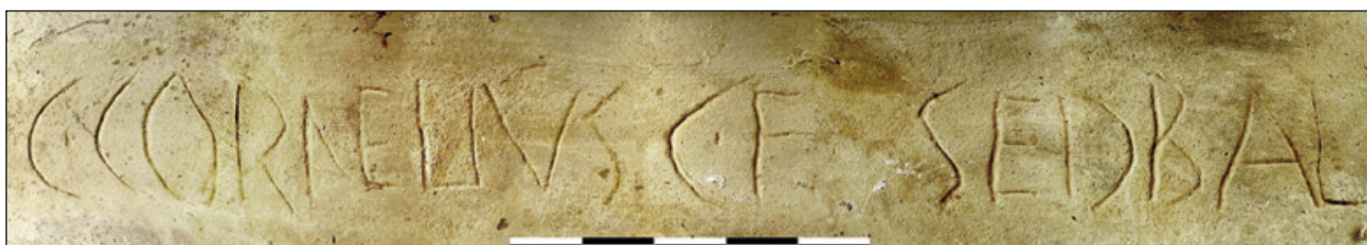
Figura 7. Desarrollo completo del grafito