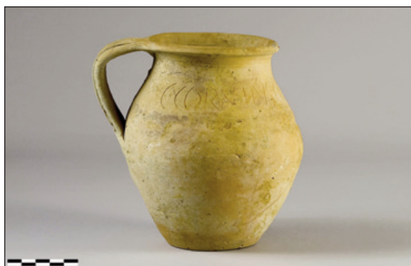
Figura 3. Vista del perfil de la pieza.

exterior con el labio redondeado de sección triangular, cuello ancho y bajo, cuerpo globular, un asa que arranca desde el labio de sección ovalada con tendencia aplanada decorada con tres surcos longitudinales, y base plana. La pasta es anaranjada, de textura compacta con finas partículas de mica plateada como desgrasante recubierta al exterior con un engobe de color beige que parece indicar su producción en un ámbito local o regional. Sus medidas son 9,4 cm diámetro boca, 6,5 cm diámetro base y 15,5 cm de altura 5 . La pieza presenta un acabado tosco, con gotas de arcilla adherida, arañazos y otras pequeñas deformaciones y sería utilizada para el servicio de mesa. (Véanse Figs. 3 y 4). De la pieza se extrajo toda la tierra de su interior para proceder mediante cribado a la identificación y estudio de posibles elementos rituales, puesto que en principio se nos comunicó que podría tratarse de un hallazgo ritual, una ofrenda de fundación, suposición que quedó finalmente descartada. El estudio del contenido de la jarrita no dio ningún resultado 6 .