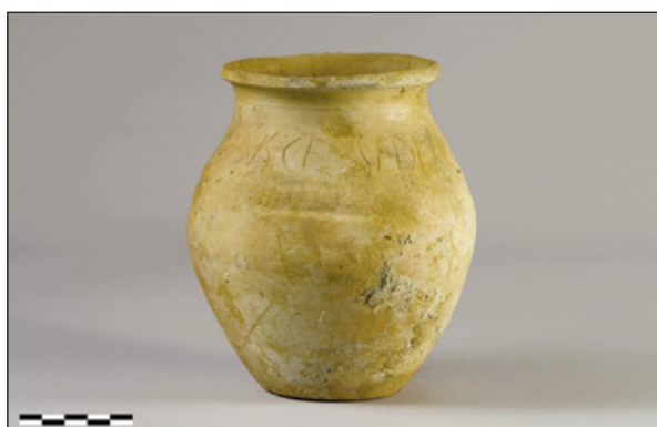
Figura 4. Vista frontal de la pieza