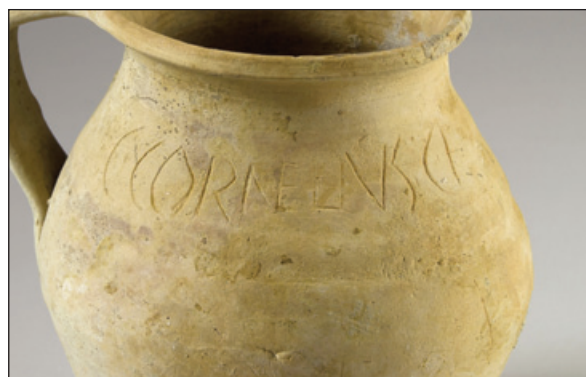
Figura 5. Detalle del grafito

No es este el foro ni tampoco es nuestra intención entrar en el debate acerca de la tipología de este tipo de hallazgos, inscripciones sobre soportes muebles y más concretamente sobre los problemas de la interpretación de los grafitos sobre cerámica (Díaz Ariño, 2008: 75; Ozcáriz Gil, 2009: 547-549; Andreu Pintado, 2009: 586-588). Nos encontramos ante un grafito sobre instrumentum , en nuestro caso se trata de un titulus scarifatus grabado post cocturam . Su lectura no presenta ninguna dificultad y se habría realizado con un punzón de punta fina u objeto semejante. Representaría una marca de propiedad con el nombre completo ( tria nomina más filiación): C CORNELIVS C F SEDBAL (véanse Figs. 5 y 6). Sobre la funcionalidad del grafito volveremos más adelante.