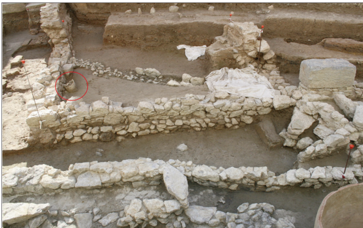
Figura 1. Vista general del Edificio 2. El ánfora está clavada en el suelo, sobresaliendo respecto del mismo unos 30 cm.