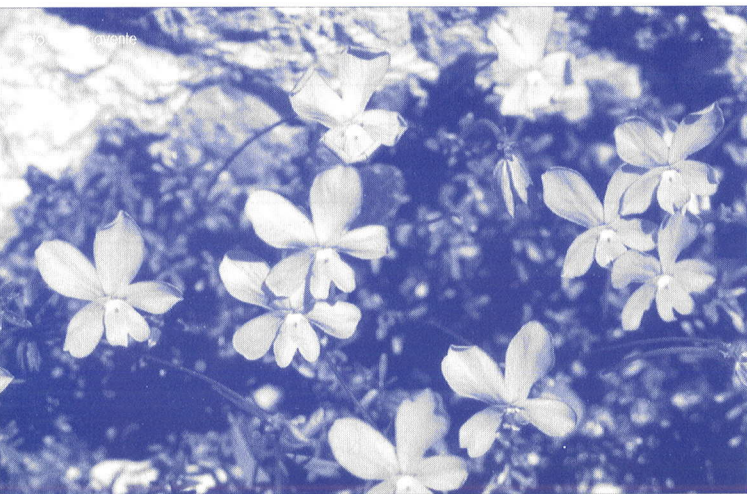
La violeta de Cazorla ( Viola cazorlensis Gand.)

ha sido una de las primeras especies consideradas en el programa de Jardines Botánicos del Parque