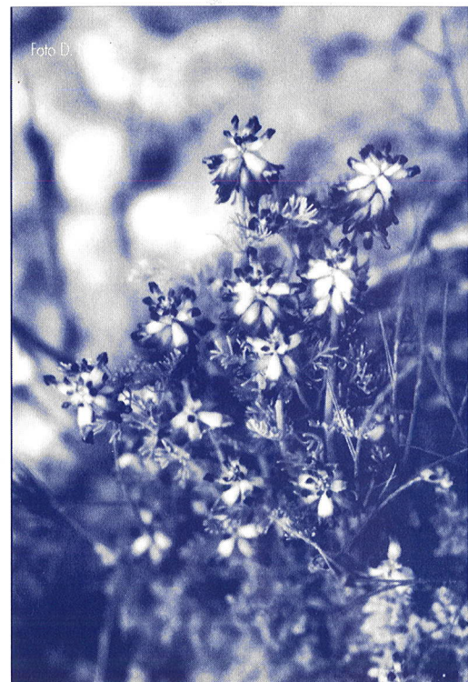
Platycapnos tenuilobus Pomel ssp. parallelus Lidén en la sierra de Alcaporales

En este grupo incluimos Asplenium petrarchae subsp. bivalens y Cosentinia vellea subsp. bivalens , con compleja entidad taxonómica, sin ningún tipo de diferenciación autoecológica ni morfológica con las subespecies tipo, las cuales no están amenazadas.