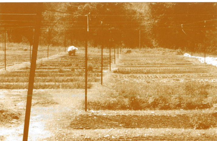
Panorámica del vivero del Jardín Botánico de la Torre del Vinagre, Cazorla