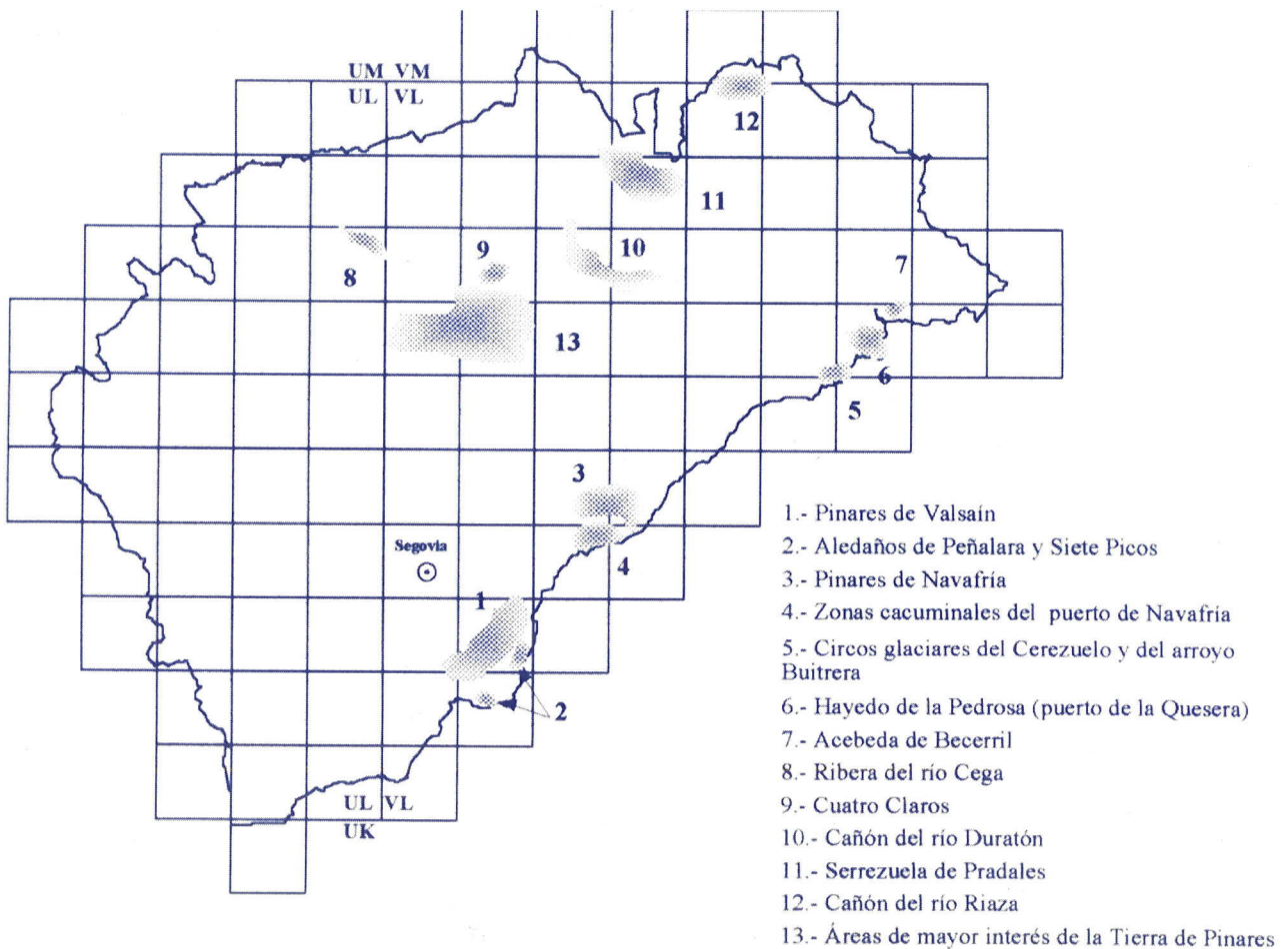
Enclaves de interés botánico de la provincia de Segovia

constituyen interesantes endemismos ibéricos de distribución muy restringida, que aparecen incluidos en diversos listados de flora protegida, tanto peninsulares como europeos. La categoría de "Vulnerable" ha sido aplicada a 25 taxones. Entre éstos podemos destacar la presencia de endemismos ibéricos tales como Dianthus gredensis , Endressia castellana , Laserpitium eliasii , Veronica chamaepithyoides , Veronica javalambrensis , Vulpia fontquerana ... También aparecen dentro de esta categoría plantas con distribuciones más amplias y de alto valor en el conjunto provincial. Este es el caso de Cytisus decumbens ,