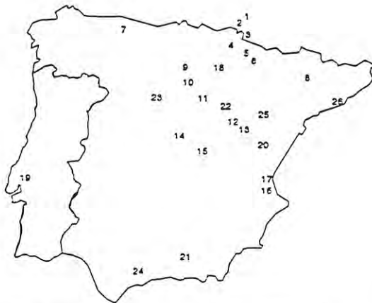
FIGURA 1. Yacimientos peninsulares con restos de castor según Liesau (1993) incluyendo el resto de Ronda. Pleistoceno med/sup: 1-Dufaure; 2-Gatzarria; 3-Olha; 4-Lezetxiki; 5-Coscovilo; 6-Zatoya; 7-Cueva de las Hienas; 8-Els Muricecs; 9-Cueva de la Blanca; 10-Atapuerca; 11-Cueva Millán; 12-Cueva de las Figuras; 13-Cueva de los Casares; 14-Pinilla del Valle; 15-Aridos; 16-Cova Negra. Meso/Neolítico: 17-Cova del Barranco Hondo. Enolítico: 18-La Peña; 19-Vilanova de S. Pedro. Edad del Bronce: 20-Sima del Ruidor?; 21-Cuesta del Negro. Edad del Hierro: 22-Ucero; 23-El Soto de Medinilla. Ibérico: 24-Ronda. Romano: 25-Bilbilis. Medieval: 26-Sant Pere de Gavá.

El castor es uno de los roedores más escasos de la Península Ibérica como ha quedado puesto de manifiesto en recientes revisiones sobre el tema (Alvarez et al. , 1992; Liesau, 1993). En este registro existen además una serie de lagunas llamativas tanto a nivel geográfico (con la mayoría de los hallazgos concentrados en la mitad septentrional del territorio) (Figura 1), como temporal ya que los hallazgos del Pleistoceno medio y superior presentan un hiato postpaleolítico que no vuelve a proporcionar evidencia hasta el Neolítico. Por todo lo que sabemos, el castor perdura en Iberia hasta época medieval como parece indicar el hallazgo de una fibula en el yacimiento de Sant Pere de Gavá (Liesau, 1993).