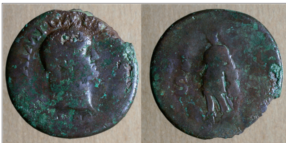
Figura 3. Sestercio de Galba RIC 392.

breve periodo de gobierno de Galba, consecuencia de los procesos de circulación monetaria flavia y antonina que abastecen la cornisa cantábrica durante el último tercio del siglo I d.C. y en la segunda centuria.