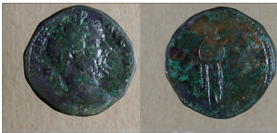
Figura 4. Sestercio de Septimio Severo RIC 689.

datados en época antonina (Villa Valdés y Gil Sendino, 2006; Gil Sendino y Villa Valdés, 2006).