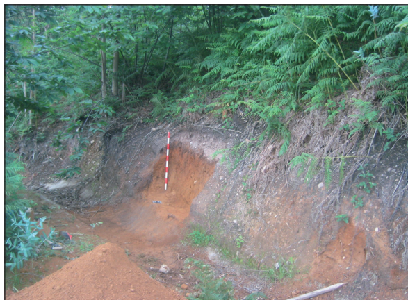
Figura 2. Corte estratigráfico practicado en el talud donde aparecieron las monedas romanas.

Una vez conocido el hallazgo monetario, se reconoció el terreno nuevamente con un detector de metales y se ejecutó un sondeo arqueológico, perfilando un pequeño sector para obtener una muestra de las condiciones del depósito y el registro estratigráfico (Fig. 2).