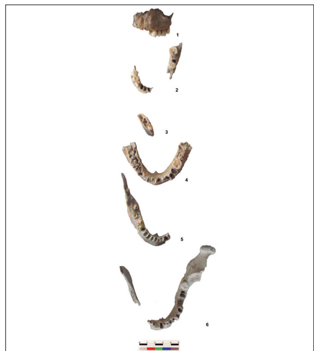
Figura 2. Selección de maxilar y mandíbulas humanas procedentes de Camino de las Yeseras (maxilar; vista frontal; mandíbulas, vista superior o craneal).

Muy significativo resulta también el hallazgo de uno de estos restos de un maxilar en un tramo del cuarto foso, todavía pendiente de estudio. Así mismo, otros fragmentos de frontal y dos húmeros han aparecido en el tramo norte de la entrada NE del cuarto foso de Camino de las Yeseras (ver fig. 1 y tabla 2). Este dato no tendría mayor interés si no estuviera en un contexto de nivel fundacional en la misma base del foso y asociado al depósito de un can completo y varias mandíbulas de otros individuos (fig. 3) (Liesau et al. , 2013-14).